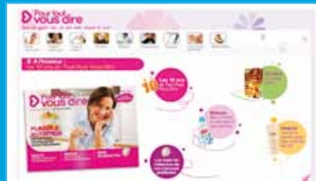
Comercialización electrónica Unilever