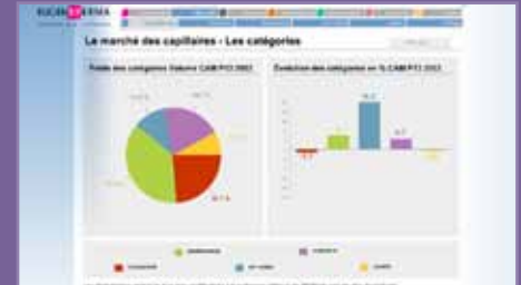
Book de venta Eugène Perma