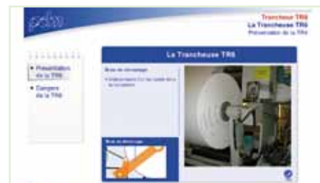
Formación asistida Papeteries de Mauduit