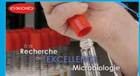
Diaporama seminario Oxoid