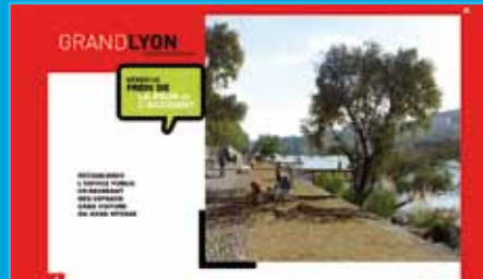
Soporte de presentación Grand Lyon