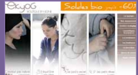
Sitio de comercio electrónico Ekyog