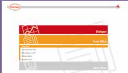
Mando a distancia multimedia Henkel