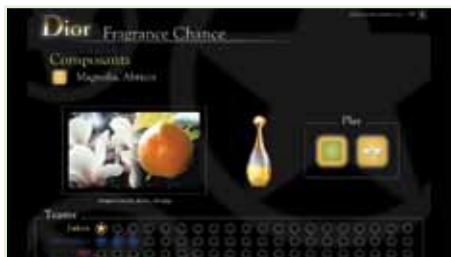
Cuestionario interactivo Dior