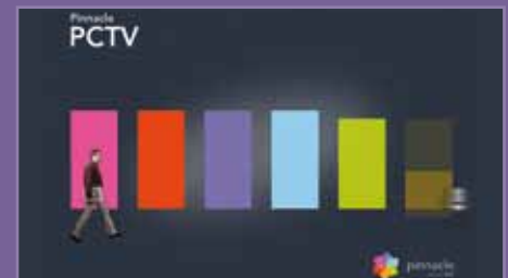
Animación promocional Pinnacle System