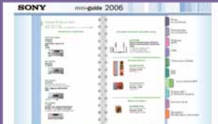
Catálogo producto Sony