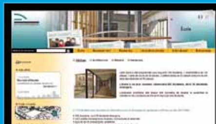
red interna - red externa Ecole d'Architecture de Bretagne