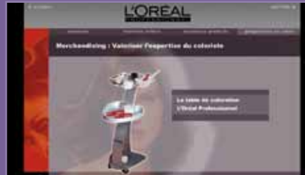
Argumentación interactiva L'Oréal