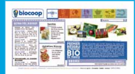
Sitio institucional Biocoop