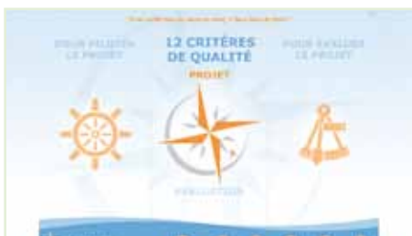
Transferencia de habilidades Groupe URD