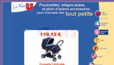
Terminal interactivo Système U