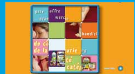
Animación de seminarios Blédina