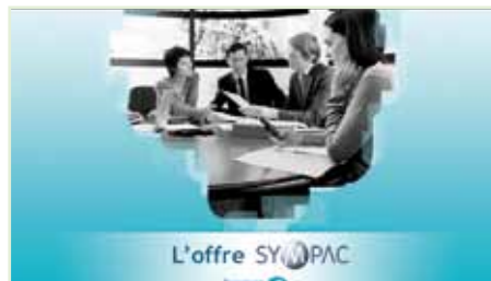
Formación interna Bouygues Télécom