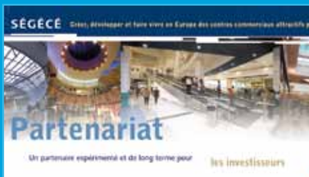
Vestíbulo de recepción Televisión corporativa Ségécé