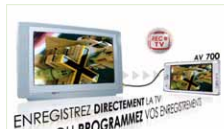
modo de empleo animado Archos