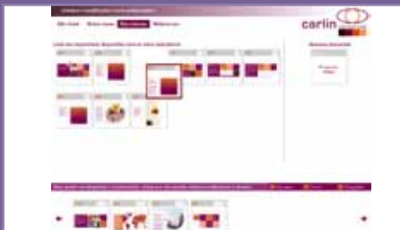
Presentación personalizable Carlin