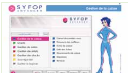
Cd de formación Eugène Perma