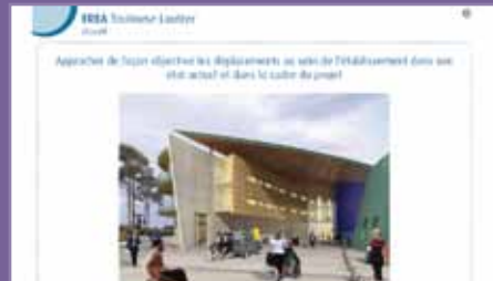
Presentación de ofertas abiertas Conseil régional IDF