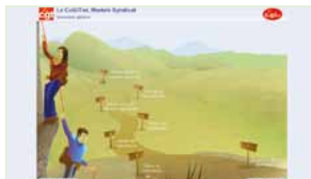
Sitio de formación en línea CGT