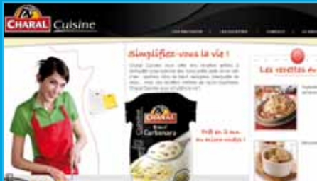
Sitio de lanzamiento de producto Charal