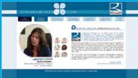
Sitio de presentación de eventos Roullier / Dirigeants2010