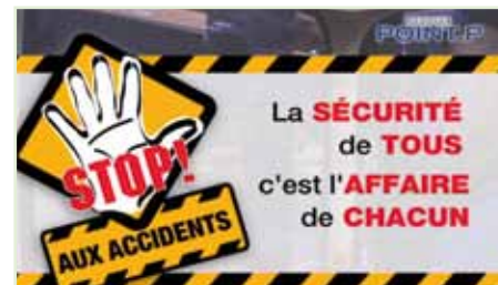
Película de formación Point.P